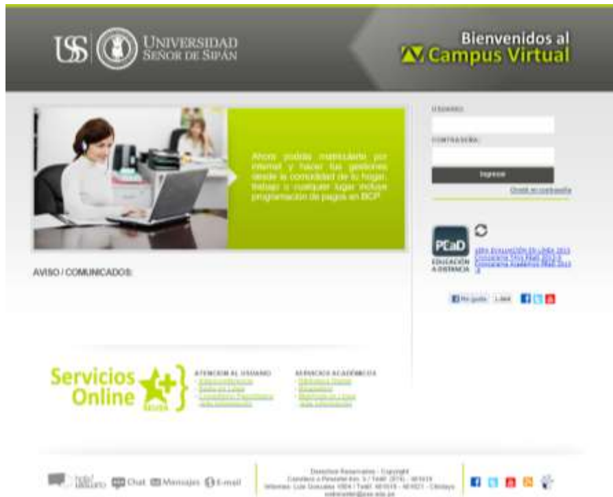
Ilustración 1: Si olvidaste tu contraseña ahora podrás recuperarla siguiendo las instrucciones

Para los alumnos del II al Xmo o XI ciclo, recuerden que: Si te falta algún curso de inglés o computación que debes llevar éste semestre y es necesario que primero hagas el registro correspondiente.